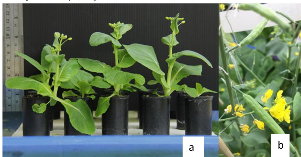
Figure 1 Chinese cabbage cultivate under room temperature. (a) Chinese cabbage flowering at 30 days after transplant. (b) Chinese cabbage pod at 14 days after pollination

เพาะเมล็ดพ่อแม่พันธุ์ผักกาดขาวปลี 6 สายพันธุ์ (23-6 , 23-8-7, 23-9-3, 27-8-7, 142-6-5 และ 142-7-12) ใส่ Petri dish 1-2 วัน จากนั้นนำไปวางในตู้เย็นที่อุณหภูมิ 5-10 องศาเซลเซียส นาน 2 สัปดาห์ แล้วจึงนำมาปลูกในกระบอกฟิล์ม ที่เจาะรูแล้ววางรองปิดทับที่ก้นกระบอกด้วยผ้าวีนาเรที่มีคุณสมบัติในการดูดซับน้ำ ก่อนบรรจุด้วยพีทมอส และมีการให้ปุ๋ยละลายช้าสูตร 13-13-13 จำนวน 3 เมล็ด วางภาชนะปลูกบนแผ่นโฟมที่อยู่ภายในถาดพลาสติก ให้น้ำทุกวันและให้ปุ๋ยสูตร Hoagland สัปดาห์ละครั้ง วางถาดไว้ในห้องควบคุมอุณหภูมิที่ 22 องศาเซลเซียส และเปิดแสงไฟจากหลอดฟลูออเรสเซนต์ ความเข้มแสงประมาณ 3,000-6,000 ลักซ์ ตลอด 24 ชั่วโมง เมื่อผักกาดขาวปลีมีอายุ 25-30 วัน จะเริ่มแทงช่อดอก (Figure 1a) เริ่มผสมเกสรโดยนำเกสรเพศผู้ของพันธุ์แท้ไปป้ายลงบนยอดเกสรเพศเมียของต้นแม่พันธุ์ ทำการผสมข้ามในสายพันธุ์ดังกล่าวแบบพบกันหมดและติดป้ายแท็ก ดอกที่ได้รับการผสมจะพัฒนาและขยายขนาดใหญ่ (Figure 1b) จากนั้นรอจนกระทั่งฝักแก่(เปลี่ยนเป็นสีเหลือง-น้ำตาล) จึงนำเมล็ดมาผึ่งให้แห้ง แล้วเก็บใส่ถุงพลาสติกปิดผนึกไว้ในตู้เก็บเมล็ดพันธุ์ที่อุณหภูมิ 4-10 องศาเซลเซียส ความชื้นสัมพัทธ์ 60-70 เปอร์เซ็นต์