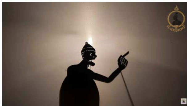
ภาพที่ 7 เพลงศิลปินสิ้นหวัง-หนังแก้ว ศ.นครินทร์ [OFFICIAL MV]