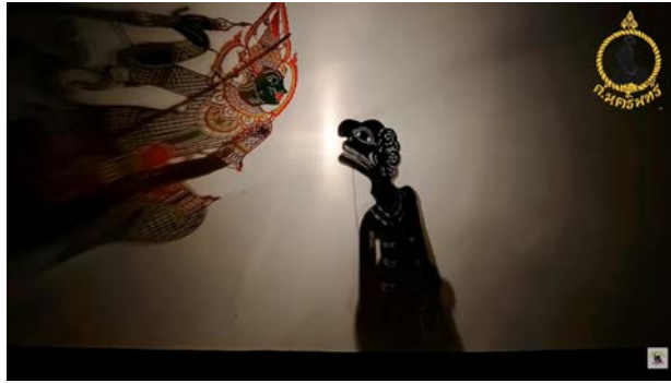
ภาพที่ 8 เพลงจุดเทียนร้องทุกข์-หนึ่งแก้ว ศ.นครินทร์ [OFFICIAL MV]