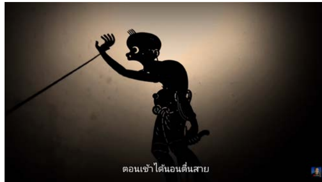
ภาพที่ 1 เพลงเรียนออนไลน์-เด็กชายเณรแต่ด ของหน้กค้กดี เสรีศิลป์

ก็ไม่รู้เรื่อง ไปงานก็เปลืองเอามาให้รัก ปลายภาคเราค่อยสบตก ทำหน้าซ้กทกเราไปชกครู” (ซ้กทก หมายถึง กริยาอาการที่ไม่พอใจหรืองอน) ซึ่งโดยรวมแล้วชี้ให้เห็นปัญหาที่เกิดขึ้น ถึงแม้จะมีการกล่าวว่่านักเรียนดีใจที่ได้เรียนออนไลน์ แต่เมื่อพิจารณาให้ถี่ถ้วนในเนื้อหาของเพลงแล้ว จะทำให้เข้าใจได้ว่าความหมายของผู้แต่งคือการประชดประชัน