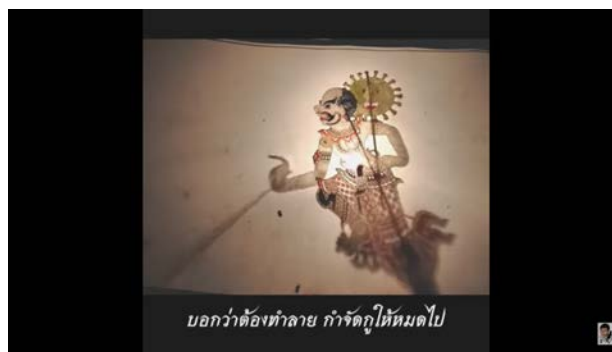
ภาพที่ 11 ศิลปินยักษ์โควิด จากเมืองอูฮั่น ของหนังไซ้หุ่นยี่ ศ.ตะลุงบัณฑิต

นอกจากนี้ ธนศักดิ์ เขียรโชติ (2563) หรือหนังไซ้หุ่นยี่ ศ.ตะลุงบัณฑิต ก็ได้อัปโหลดคลิปในแนวเดียวกัน คือการแนะนำโรคซึ่งมีทั้งการร้องกลอนและเล่นบรรยาย โดยใช้ชื่อคลิป “ยักษ์โควิดจากเมืองอูฮั่น” ความยาวคลิป 6 นาที 6 วินาที โดยมีเนื้อหาเกี่ยวกับที่มาของเชื้อไวรัสที่เริ่มระบาดมาจากเมืองอูฮั่น ประเทศจีน ซึ่งเป็นเชื้อที่แพร่ไปในหลายประเทศทั้งฝั่งยุโรป อเมริกา เอเชีย หรือแม้กระทั่งประเทศไทย และยังมีการพูดถึงประเด็นที่เกี่ยวข้องกับวลี “โรคนี้ไม่น่ากลัวเพราะเป็นแค่ไข้หวัดธรรมดา” มากไปกว่านั้น มีการพูดถึงการใส่หน้ากากอนามัยที่จะช่วยให้ปลอดภัยได้แต่เป็นสิ่งที่ยักษ์โควิดไม่ชอบ ดังประโยค “สิ่งที่ยักษ์รำคาญมากคือหน้ากากอนามัย จะปลอดภัยยักษ์โควิดต้องมีติดหนทาง” และ “ไปอิตาลีพินมาเก๊าไปเข้าสหรัฐ กูจะกำจัดเช่นฆ่าทำลายพวกมนุษย์” จากข้อความในการร้องกลอนข้างต้น มีทั้งการบอกกล่าวเล่าเรื่องถึงที่มา ซึ่งให้เห็นการแพร่ระบาดที่กระจายได้อย่างรวดเร็ว กล่าวถึงความรุนแรงที่สามารถทำให้ผู้คนล้มตายได้ และยังชี้แนะแนวทางป้องกันคือการสวมหน้ากากอนามัย