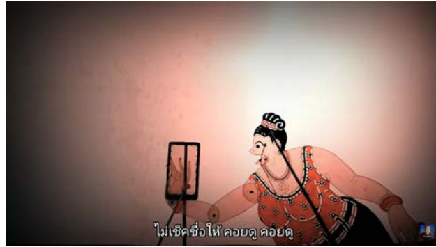
ภาพที่ 2 เพลงสอนออนไลน์-ครูก็ก ของหนังกัดดี เสรีศิลป์