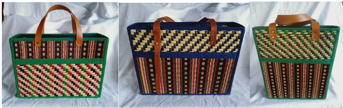
ภาพที่ 3 แสดงการพัฒนาผลิตภัณฑ์ ระยะที่ 2 ทดลองวางตำแหน่งลายทอและลายสานใหม่

2.2 กลางทาง การทดลองปฏิบัติการตามกลยุทธ์การพัฒนากลุ่ม 4 ด้าน มีรายละเอียด ดังนี้ 1) ด้านการบริหารจัดการ พบว่า กลุ่มได้แลกเปลี่ยนเรียนรู้การดำเนินการบ่อยมากขึ้น เมื่อจัดกิจกรรมหนุนเสริมที่ทำให้สมาชิกกลุ่มได้มีการแลกเปลี่ยนเรียนรู้กันในหลายประเด็น โดยมีประธานกลุ่มเป็นผู้ดำเนินการเนื่องจากมีอายุน้อย มีความคล่องแคล่ว มีมนุษยสัมพันธ์ที่ดี สามารถเป็นตัวแทนเข้าอบรมและพัฒนาความรู้ทุกมิติอย่างต่อเนื่อง 2) ด้านบุคลากร พบว่า กลุ่มได้พัฒนาสมาชิกจนสามารถพัฒนาผลิตภัณฑ์ตามความต้องการของกลุ่มผู้ซื้อเป้าหมาย การสร้างความแตกต่างด้วยการเปลี่ยนเทคนิควิธีการสาน การทอ การผสมผสานวัสดุ การลดทอนรายละเอียดของผลิตภัณฑ์