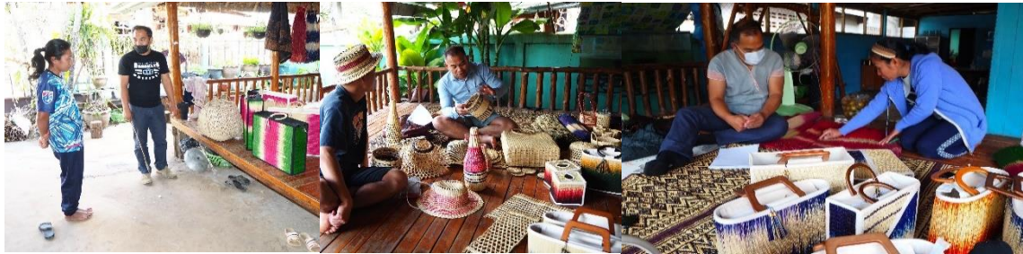
ภาพที่ 2 แสดงการพัฒนาศักยภาพการออกแบบ การพัฒนาและการแก้ปัญหาตลอดโครงการ

พัฒนาทักษะการบริหารจัดการกลุ่ม การออกแบบและพัฒนาผลิตภัณฑ์ที่แตกต่างโดยใช้แนวคิดสร้างสรรค์ และสร้างเครือข่ายจำหน่ายผลิตภัณฑ์ สำหรับระยะนี้กิจกรรมพัฒนาศักยภาพกลุ่ม จะเน้นการเตรียมความพร้อมด้วยกิจกรรมการคิดวิเคราะห์ การแลกเปลี่ยนเรียนรู้ และอบรม และพัฒนาทักษะให้คงที่ขึ้น โดยกิจกรรมเน้นความร่วมมือร่วมใจของสมาชิกและเครือข่ายให้ร่วมขับเคลื่อน ดังคำกล่าวที่ว่า “...กิจกรรมการวิเคราะห์สภาพ และค้นหาแนวทางขับเคลื่อนกลุ่ม ช่วยให้สมาชิกเห็นความจำเป็นที่จะต้องเปลี่ยนความคิดแบบใหม่ เพื่อให้การดำเนินการเป็นไปอย่างมีประสิทธิภาพ ช่วยให้สมาชิกเห็นเป้าหมายปลายทาง อันจะส่งผลต่อความร่วมมือร่วมใจ และมีส่วนร่วมดำเนินงานตามบทบาทหน้าที่ของตนเองอย่างเต็มที่...” (วรรณิ แสนมา, การสื่อสารส่วนบุคคล, 15 สิงหาคม 2566)