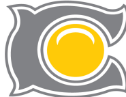
แบบเครื่องหมาย 2 สี (2 Colors Mark)