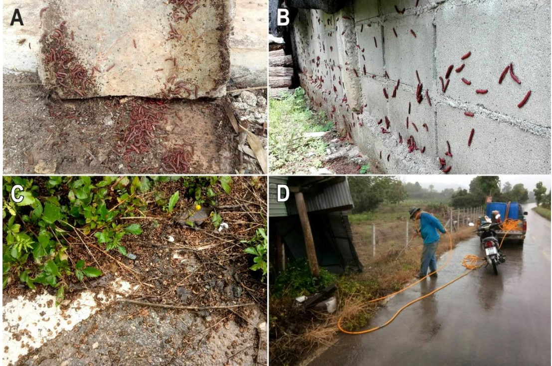
Figure 1. Millipede swarm of Antheromorpha uncinata at San Klang subdistrict, Phan district, Chiang Rai province, Thailand. (A-C) Swarming individuals, individual long 3.2-4.7 cm (D) Provincial Administration Organization staff sprayed insecticide to control the swarming millipedes

ด้านบน อาหารของกิ้งกือ ใช้ผลมะม่วงสุกปอกเปลือก ผ่าครึ่งแล้ววางไว้บนเศษใบไม้ด้านบนผิวดิน ทำการเลี้ยงกิ้งกือไว้ในอุณหภูมิห้อง เป็นระยะเวลา 2 วัน ก่อนนำมาทดสอบประสิทธิภาพของสารกำจัดแมลงต่อไป