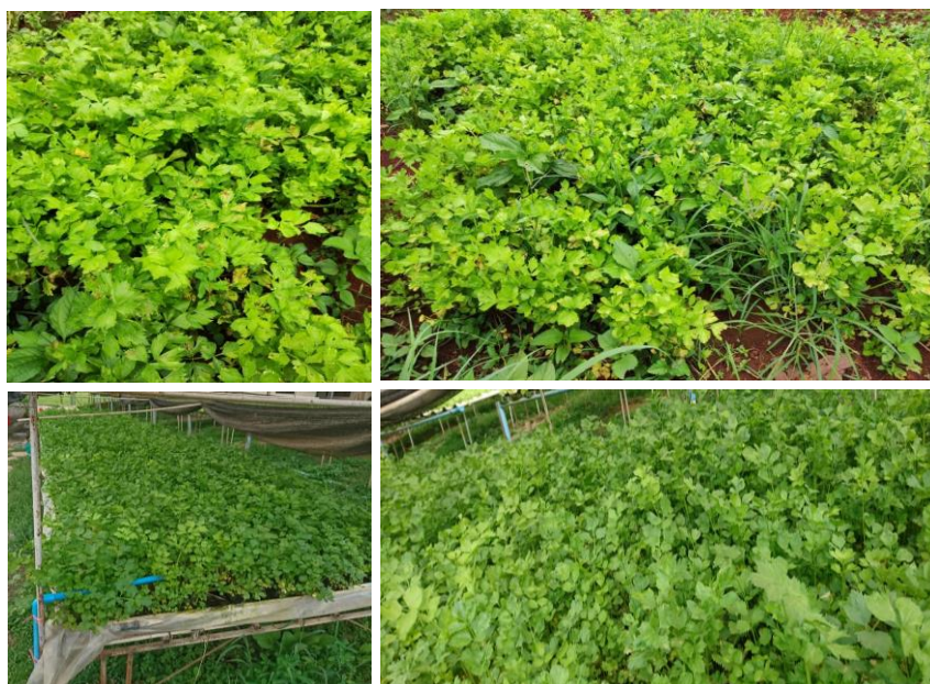
Figure 4. Field inspection and pests in the celery crop at Tak and Chiang Mai provinces