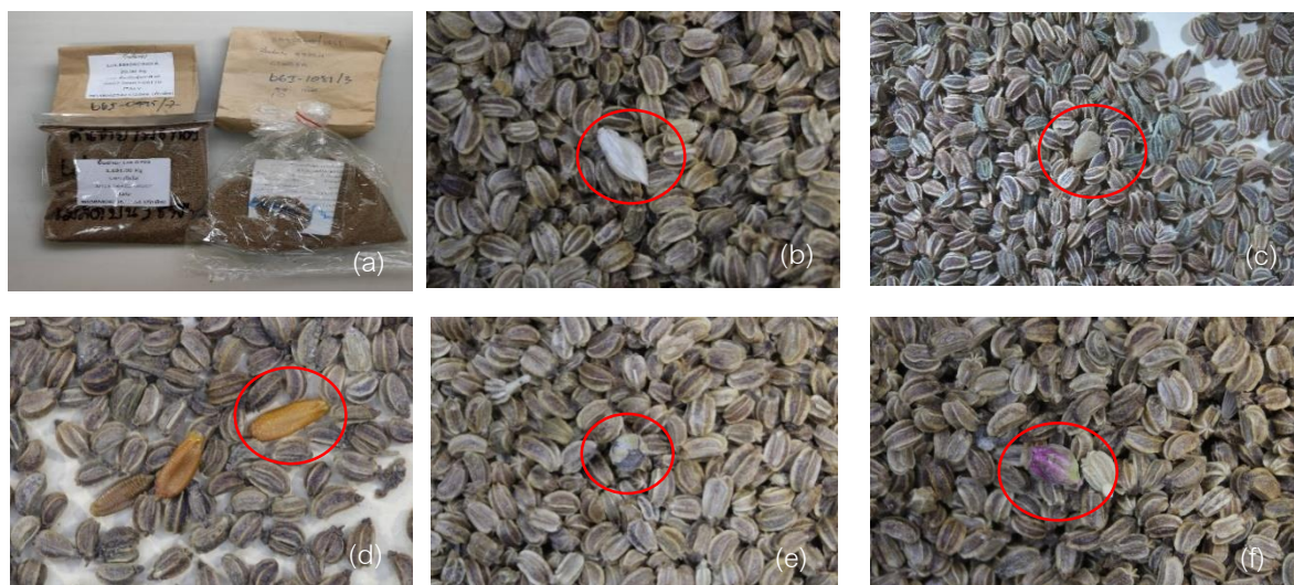
Figure 1. Contamination of weed seeds in imported celery seeds