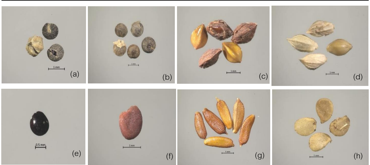
Figure 2. Species of weed seeds contaminated in imported celery seeds