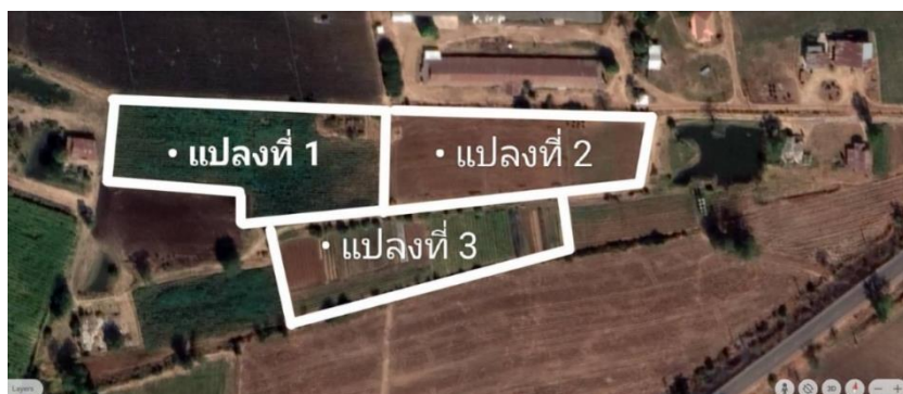
ภาพที่ 2 แสดงที่ตั้งแปลงข้าวโพดที่ใช้ในการวิจัยหมู่บ้านสระบัวทอง หมู่ที่ 12 ตำบลบ่อทอง อำเภอนองม่วง จังหวัดลพบุรี ตำแหน่งที่ตั้ง : 15.30400435637611, 100.63135187964926