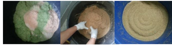
Fig. 2 Herbal mixture tom yum accessories

นำข้อมูลมาวิเคราะห์หาความแปรปรวน (ANOVA) และเปรียบเทียบความแตกต่างค่าเฉลี่ยวิธี Duncan's New Multiple Range Test (DMRT) โดยใช้โปรแกรมสำเร็จรูป