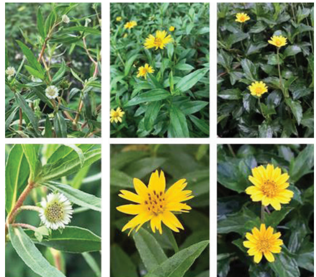
Figure 1 Whole plant and flowers of E. prostrata , S. calendulacea and S. trilobata

การเก็บตัวอย่างพืชในงานวิจัยครั้งนี้ ได้ตัวอย่างกะเม็งตัวเมียและกะเม็งตัวผู้ที่เป็น authentic ปริมาณน้อย ไม่เพียงพอสำหรับการสกัดเพื่อทดสอบฤทธิ์ต่างๆ จึงสกัด authentic ด้วย ethanol เพื่อใช้เปรียบเทียบเอกลักษณ์ทางเคมีด้วยเทคนิค TLC เท่านั้น ส่วนสารสกัดน้ำและ ethanol ของกะเม็งตัวเมียและกะเม็งตัวผู้ที่ใช้ในการศึกษาฤทธิ์ต่างๆ ใช้สมุนไพรที่จัดซื้อจากร้านจำหน่ายเครื่องยาสมุนไพรในการเตรียมสารสกัด กระดุมทองเลี้ยงใช้พืช authentic ในการสกัดเพื่อศึกษาฤทธิ์ต่างๆ รวมถึงการเปรียบเทียบเอกลักษณ์ทางเคมีด้วยเทคนิค TLC ผลการสกัดกะเม็งตัวเมีย กะเม็งตัวผู้ และกระดุมทองเลี้ยงได้ปริมาณสารสกัดน้ำคิดเป็นร้อยละ 7.21, 6.49 และ 8.38 ตามลำดับ สารสกัด ethanol คิดเป็นร้อยละ 1.44, 2.01 และ 0.77 ตามลำดับ ภาพสมุนไพรทั้ง 3 ชนิด แสดงใน Figure 1