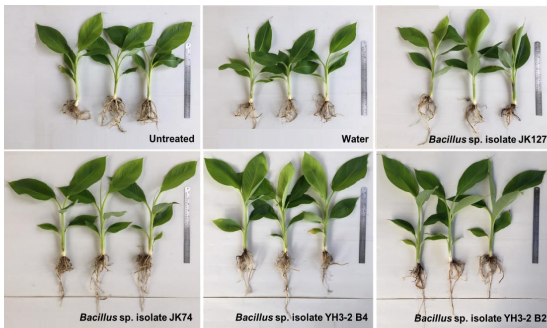
Figure 1 Five weeks old “Kluai Hin” after inoculation with Bacillus spp. isolate JK127, JK74, YH3-2B4, and YH3-2 B2 compared with water treated and untreated treatment

ด้วยแบคทีเรีย Bacillus spp. ไอโซเลต JK74 และ YH3-2B2 มีค่าเฉลี่ยมากที่สุดเท่ากับ 35.47 และ 34.35 g ตามลำดับ รองลงมาได้แก่กรรมวิธีควบคุม ทั้งสองกรรมวิธีและกรรมวิธีที่มีการแช่รากด้วย แบคทีเรีย Bacillus spp. ไอโซเลต JK127 มีค่าเฉลี่ย อยู่ในช่วง 24.87 – 30.02 g สำหรับค่าเฉลี่ยของ น้ำหนักแห้งรวมระหว่างต้นและรากพบว่ากรรมวิธี ควบคุมทั้งสองกรรมวิธีมีค่าเฉลี่ยอยู่ในช่วง 4.25 – 4.56 g รองลงมาคือกรรมวิธีที่มีการแช่รากด้วย แบคทีเรีย Bacillus spp. ไอโซเลต YH3-2 B2 และ JK74 มีค่าเฉลี่ยเท่ากับ 3.56 และ 3.26 g ตามลำดับ อย่างไรก็ตามไม่พบความแตกต่างทางสถิติระหว่าง กรรมวิธีทดลองทั้งสองกรรมวิธี ขณะที่การกรรมวิธี ที่มีการแช่รากด้วยแบคทีเรีย Bacillus spp. ไอโซ เลตที่เหลือมีค่าเฉลี่ยน้อยกว่ากรรมวิธีควบคุม (Table 1 และ Figure 1)