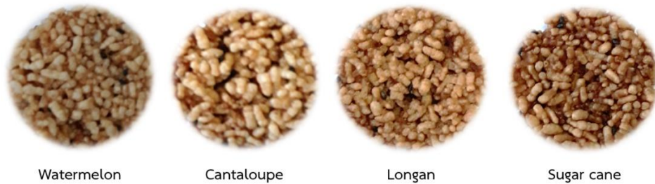
Figure 3 The appearance of rice cracker from watermelon, cantaloupe, longan and sugar cane