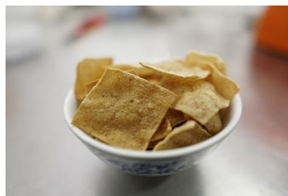
ภาพที่ 3 ข้อมูลทางโภชนาการของปลาสร้อยแผ่นกรอบ